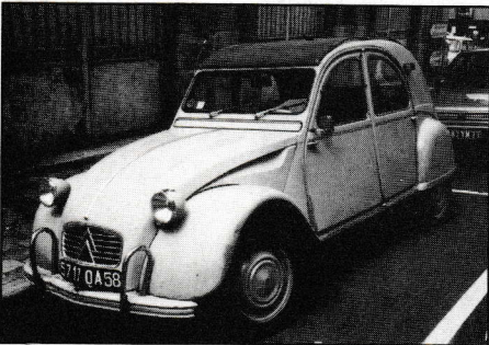
Wie aus dem Laden — sozusagen Alt-Ente ganz frisch serviert.

Zwar hatte ich mir in meinen Träumen kleine Marktplätze mit Dutzenden von Wellblech-Kastenentente ausgehört, doch es dauerte eine ganze Weile, bis ich endlich in einer Seitenstraße vor einer kleinen Citroen-