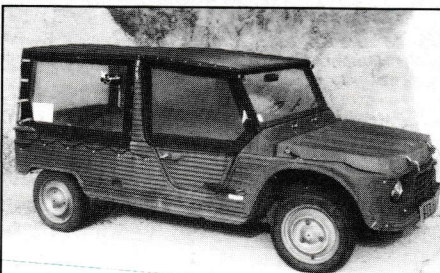
Wird in Deutschland leider nicht zugelassen: der Méhari.

bergen um das mittelalterliche Städtchen Beaune, wo u.a. auch der berühmte Pom-mard angebaut wird, noch oft anzutreffen. Und für kleinere Transporte wird der Méhari, jene Jeep-ähnliche, offene Plastik-