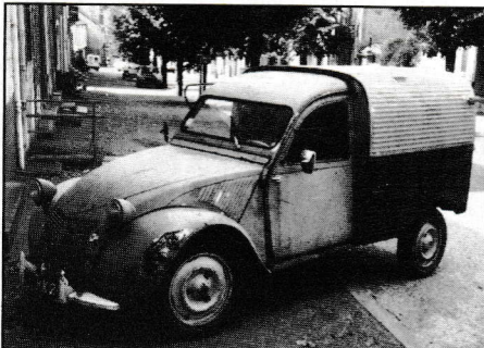
Immer noch im harten Alltagseinsatz und darum etwas blessiert...

In den nächsten Tagen hatte ich dann Gelegenheit, einen weiteren Vertreter des Hauses Citroen im Einsatz zu sehen: den ‚Wellblech-Bomber‘ HY. Dieser durch seine eigentümliche Verkleidung nostalgisch wirkende Kleintransporter ist in den Wein-